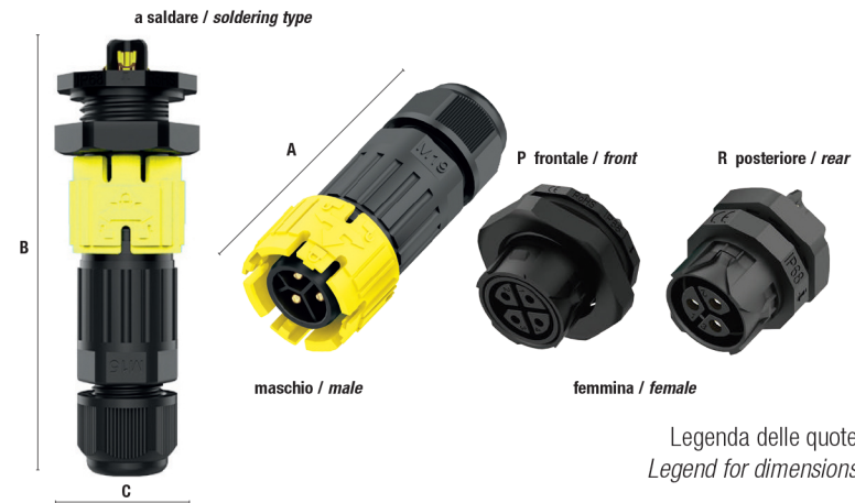
Legenda delle quote Legend for dimensions